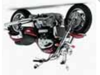
Совсем недавно компания Triumph представила свое то монстра – модель Triumph Rocket III с двигателем 2300 куб. см.

В классе супербайк купшем Чемпионате США GSX-R1000 лидирует в те- уже сейчас машина Suzuki нового шасси. Фактически для модели было создано ку. Немаловажно и то, что внешний вид и аэродинами-